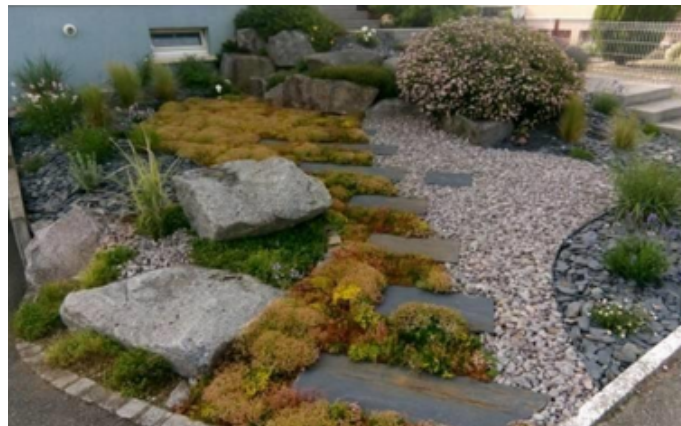
3 mois après l'installation