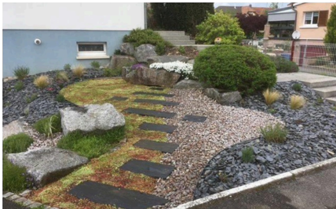
Le jour de l'installation